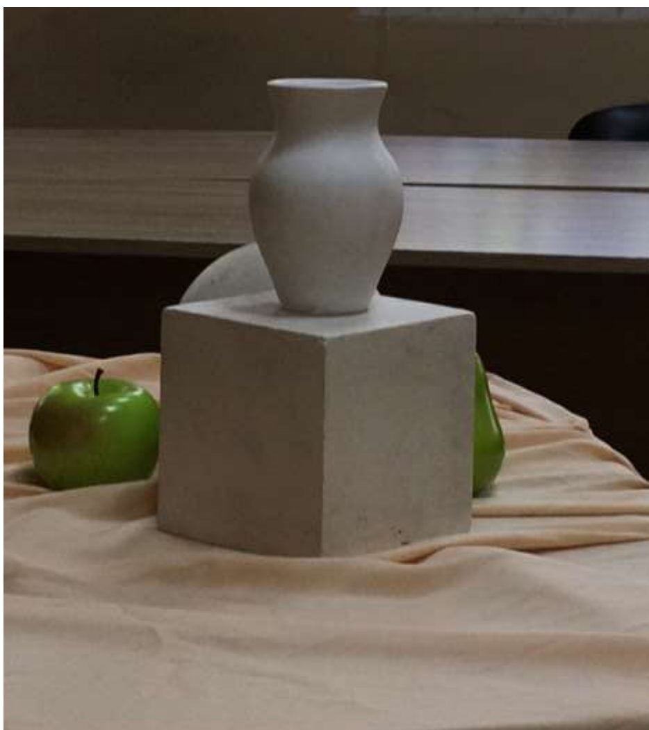
Пример постановки для вступительного испытания №3