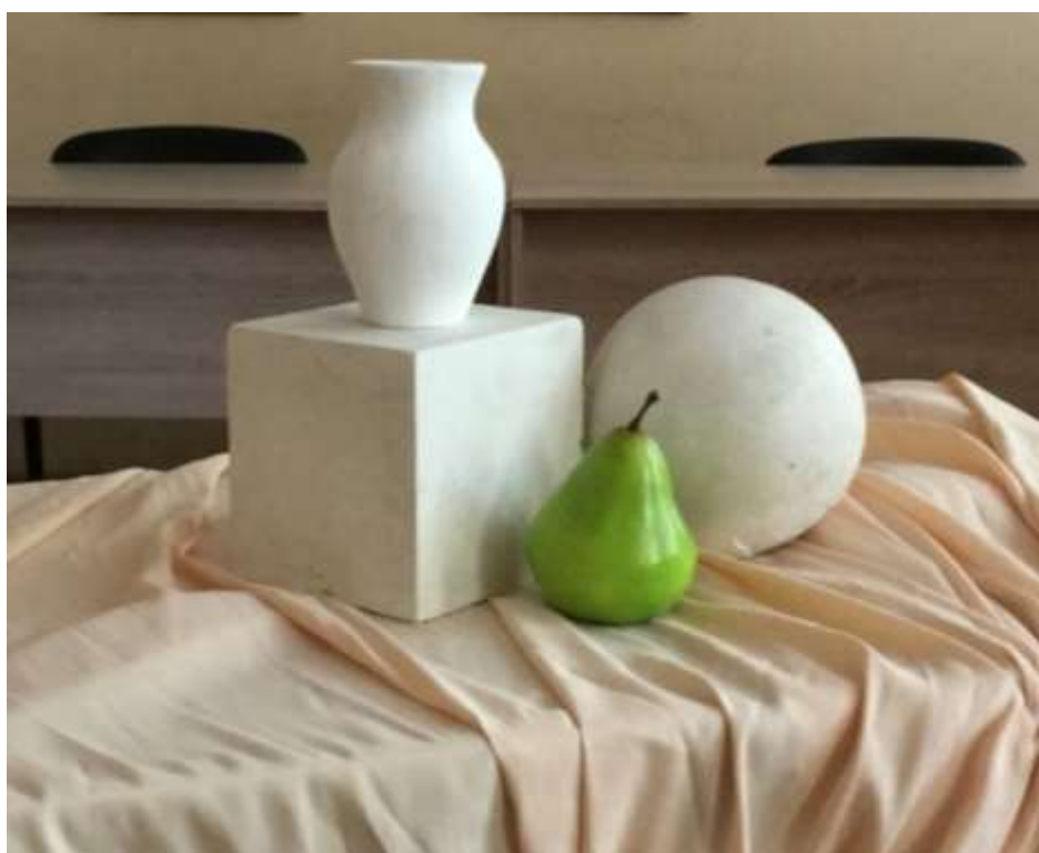
Пример постановки для вступительного испытания №2