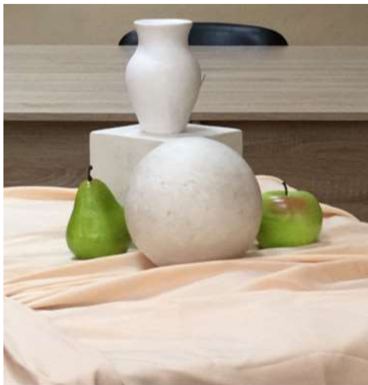
Пример постановки для вступительного испытания №1